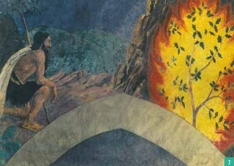
7. Tableau du Buisson ardent présent dans le cloître