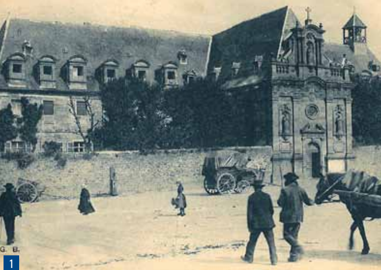
1. Vue d'ensemble du pignon sud ; la chapelle et le mur d'enceinte du monastère des Augustines