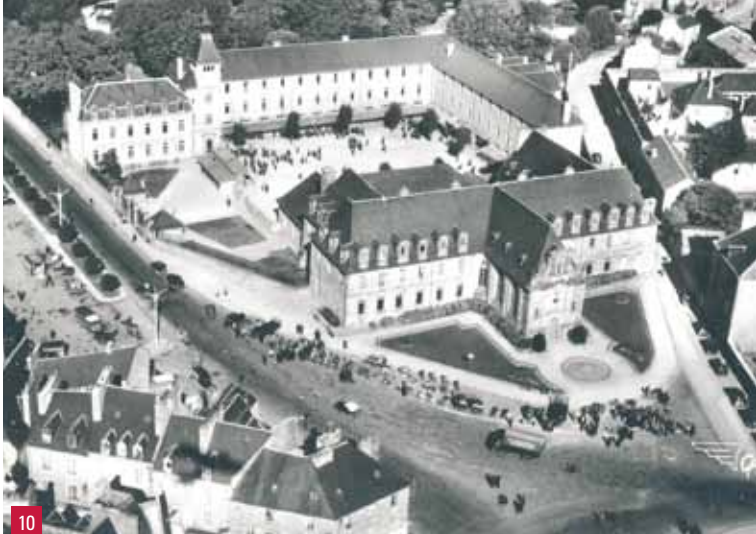
10. Mairie vue du ciel au début des années 1950 - Anciennement École Supérieure des garçons