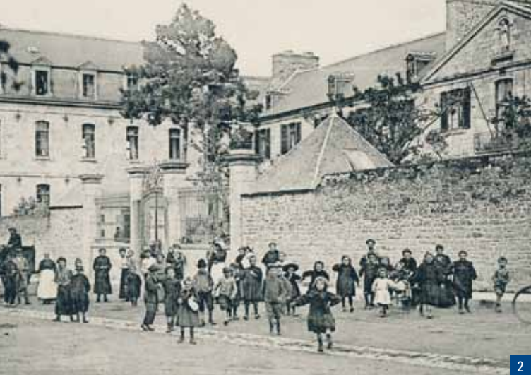
2. L'hôpital militaire, à gauche, perpendiculaire à l'hospice civil

Les Augustines seront chassées à la Révolution, période à laquelle le monastère est converti en prison, et la chapelle en écurie. En 1803, il est rendu aux religieuses.